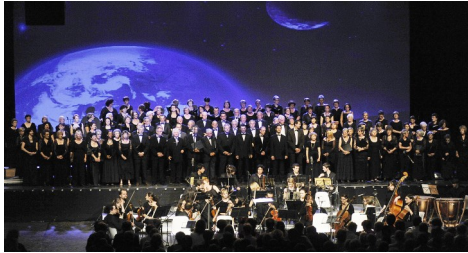
L'Ensemble Vocal— Concert « Terre Mozart »